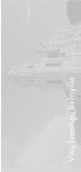
Visų šventųjų bažnyčia