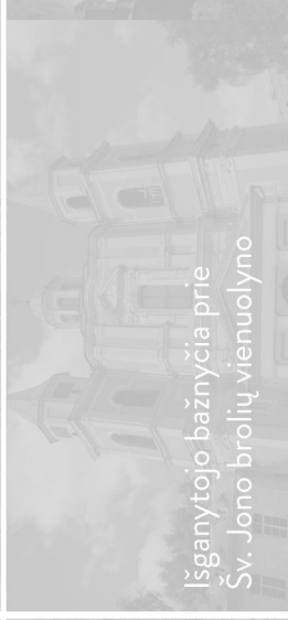
Išganytojo bažnyčia prie Šv. Jono brolių vienuolyno