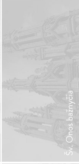
Šv. Onos bažnyčia