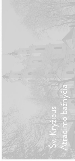
Šv. Kryžiaus Atradimo bažnyčia