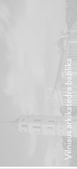
Vilniaus arkikatedra bazilika