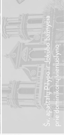
Šv. apaštalų Pilypo ir Jokūbo bažnyčia prie dominikonų vienuolyno