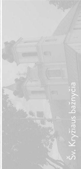
Šv. Kryžiaus bažnyčia