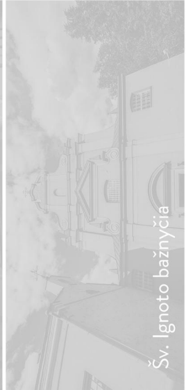
Šv. Ignoto bažnyčia