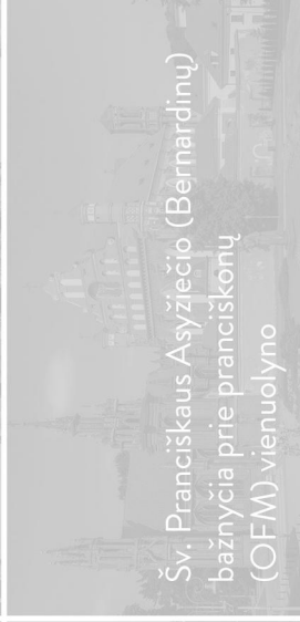
Šv. Pranciškaus Asyžiečio (Bernardinų) bažnyčia prie pranciškonų (OFM) vienuolyno