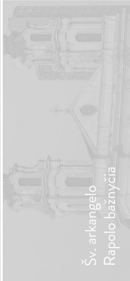
Šv. arkangelo Rapolo bažnyčia