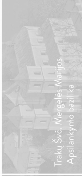
Trakų Švč. Mergelės Marijos Apsilankymo bazilika