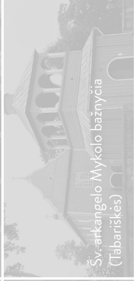
Šv. arkangelo Mykolo bažnyčia (Tabariškės)