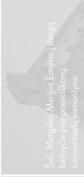
Švč. Mergelės Marijos Ėmimo į dangų bažnyčia prie pranciškonų konventualų vienuolyno