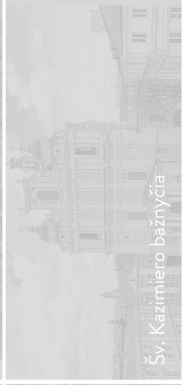
Šv. Kazimiero bažnyčia