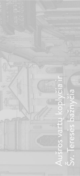
Aušros vartų koplyčia ir Šv. Teresės bažnyčia