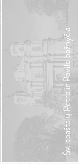
Šv. apaštalų Petro ir Povilo bažnyčia