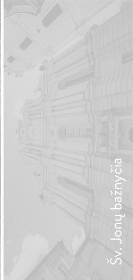
Šv. Jonų bažnyčia