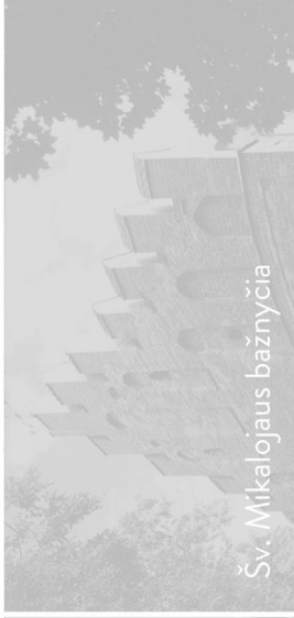
Šv. Mikalojaus bažnyčia