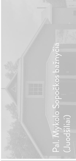
Pal. Mykolo Sopočkos bažnyčia (Luodšiliai)